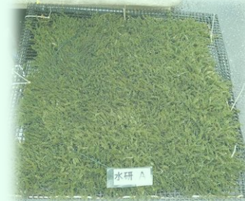
海ぶどう養殖試験状況