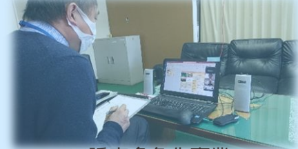
※誘客多角化事業 オンライン商談会への参加