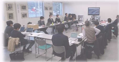
※事務局会議の様子