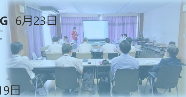
※企業さまからの提案

三重大学 6月17日 中部電力 6月18日 県 尾鷲建設事務所 6月19日 関連企業 6月24日（Web会議）